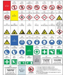
< GHS >